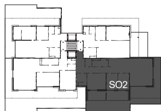
umístění v rámci patra