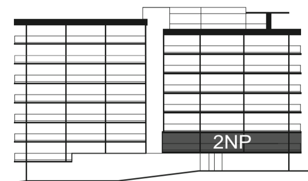
umístění v rámci domu